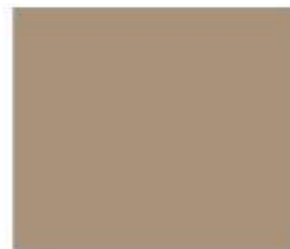
7498 Бежевий темний HighGloss