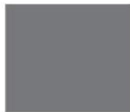
85735M Сірий Supermatt