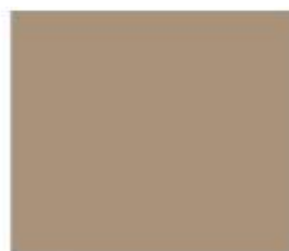
7498 Бежевий темний HighGloss