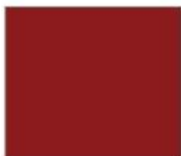
3362 Червоний HighGloss