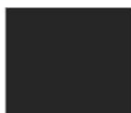
85382 Графіт HighGloss