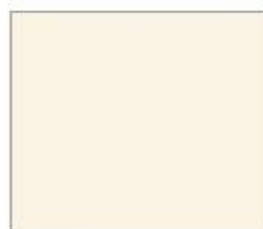
7496M Бежевий світлий Supermatt