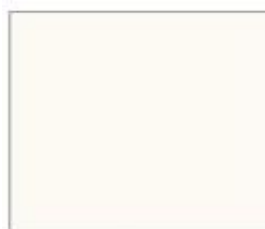
11082M Білий Supermatt