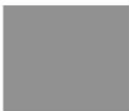
85384 Сірий світлий HighGloss