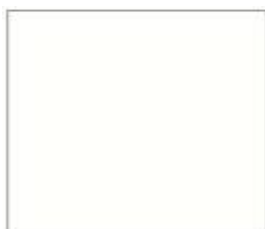
11046 Біла аляска HighGloss