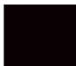
8421 Чорний HighGloss