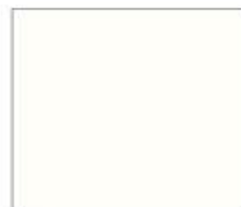
11035 Білий HighGloss Metallic