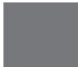
85735M Сірий Supermatt