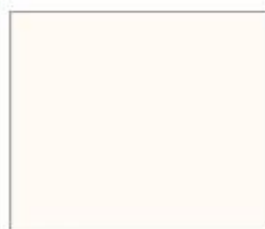
1982M Білий полярний Supermatt